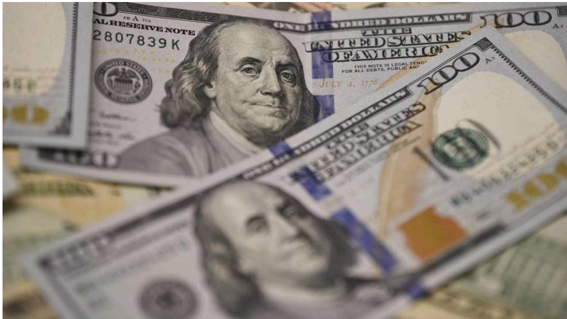
「美元崩盤論」討論多年。